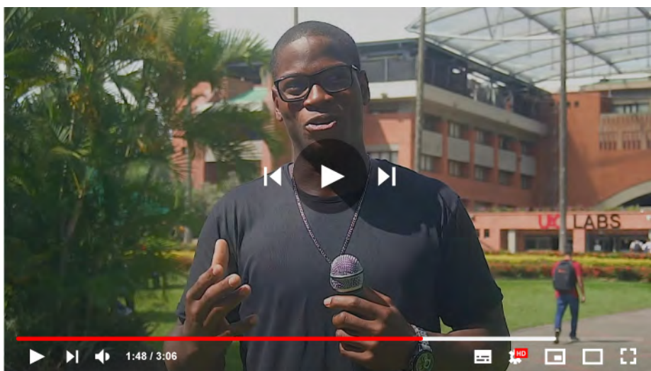
Te invitamos a darle 'play' al video de estos jóvenes talentos